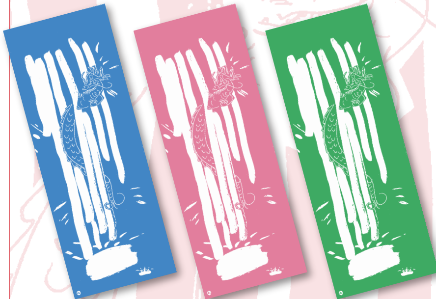
(D) 柄1 逆版—空色