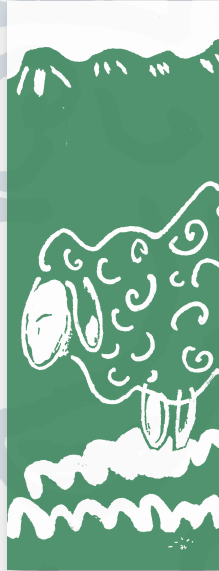
（3）羊柄 A： さわやか！ 抹茶色