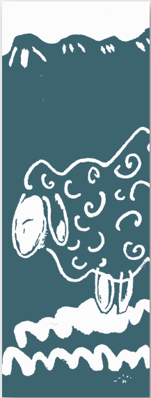
（1）羊柄 A： おしゃれ！ ダークグレー色

■お使い方法によりますが、こまめに手洗いを、シミ汚れは「すぐにチャチャットつまみ洗いし、テーブル上やガラス窓等に貼り干しをおススメ！ 乾きは早いアイロンを開けたようにピンとします。