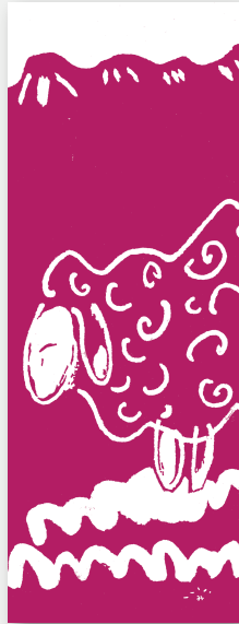
（2）羊柄 A： やさしい！ あずき色