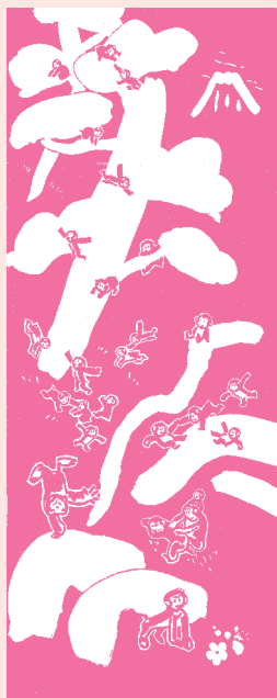
(4) 2016申 小豆色